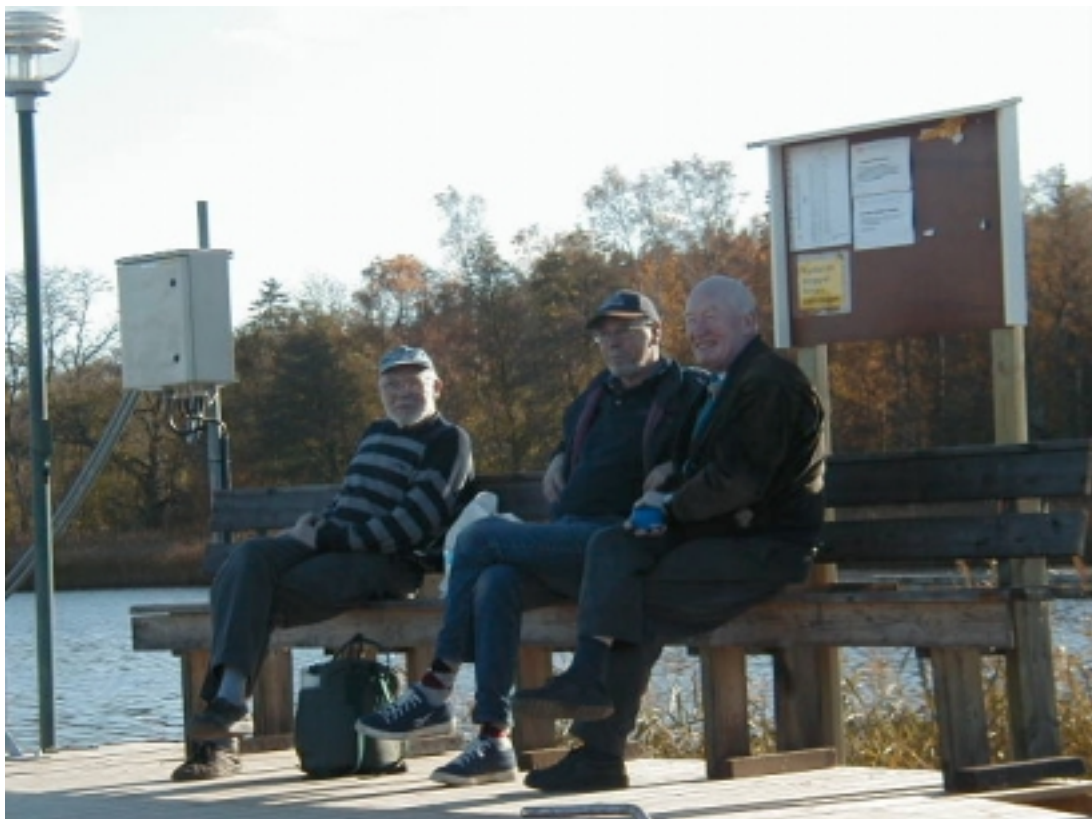
Varvets nya ljugarbänk ?