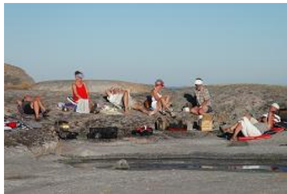
Avkoppling i ytterskärgården

Solen sken från en klar himmel och det var helt vindstilla så vi lättade inte ankare för än sommarens plåga, algerna, dök upp.