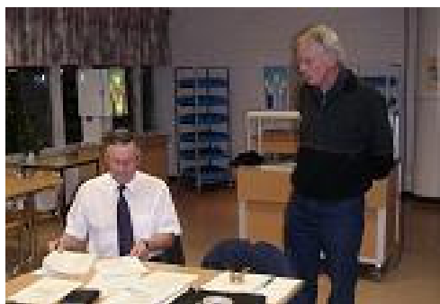
Ordförande och sekreterare i aktion

Investeringen finansieras till två tredjedelar med lån och resten med egna medel. Det är mycket tack vare att vi har drygt 500 medlemmar och därtill en välskött ekonomi som vi har fått detta nya lån beviljat.