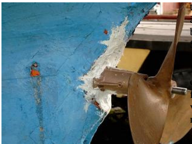
Christinas lagade genomföring

Innerdelen av hylsan gick genom en bottenstock av ek. Inne i bottenstocken hade det blivit ett korrosionshål grovt som en blyertspenna. Undra på att hon läckte! Hylsan hade ju suttit i båten sedan hon byggdes (av Christoff Rassy himself) 1962 och det var antagligen senare års landströmsanslutning som orsakat korrosion mellan hylsan och bottenstockens bultar.