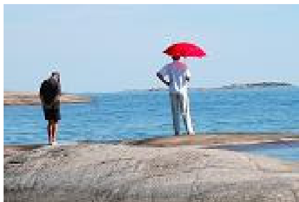
Visst var det fint i somras