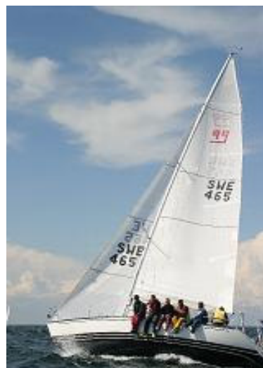
X-99 på väg mot Gunnarstenarna

vara ett bra resultat i vårt första VM. Som bäst var vi 3:a i en segling. Det tycker jag kan anses klart godkänt.