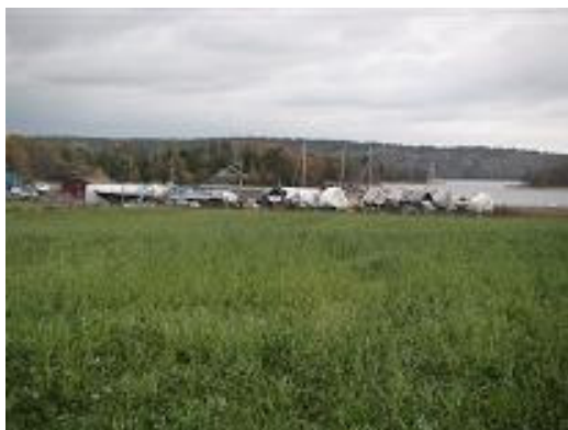
Snart är alla båtar uppe

Kommande vinter står slamkrypare nr 2 som är från 1993 i tur för att få en genomgripande uppfräschning av sitt hydrauliksystem med nya slangar och kanske även någon pump.