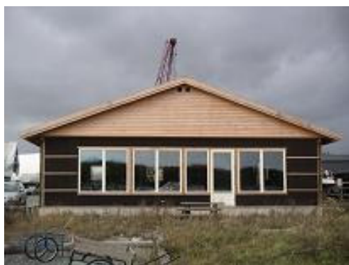
Nya klubbhuset börjar ta form