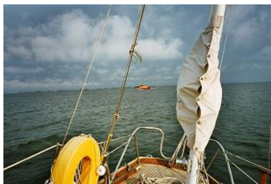
På grund med slagsida.

En ankarplats som jag återfunnit efter många års glömska är fladen syd om Braka. Det är en fin skärgård men lite knepigt att hitta in i fladen även här. Det fick jag erfara sista veckan i juli.