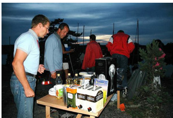
Vällyllt prisbord vid kräftköret