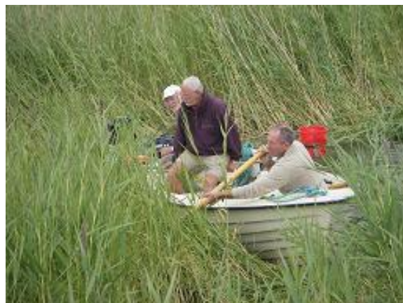
Tre vassa killar skär vass i Vissvass

båtar men vi klarade oss i alla fall. Inger och barnbarnen satt mest hela natten tätt tillsammans i en koj.