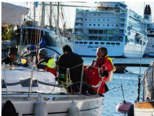
Eftersnack i sittbrunn efter Åland Race.

Lågpoängssystem med 1:a racet viktande vid lika poäng. Men ett stort grattis till segrarna! Priser till top 3 både i serien och KM delas ut i samband med vårt höstmöte.