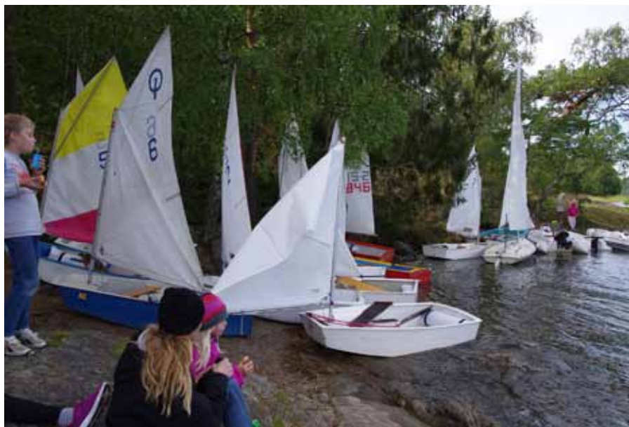
Parkeringsövning med grillpaus.

Förutom denna heldag träffas seglarskolan/piratseglarskolan vid Seglarudden vid Storängen sex gånger på våren och fyra gånger på hösten mellan kl. 17-19.30. Barnen är uppdelade i tre grupper; en för de yngsta barnen, en