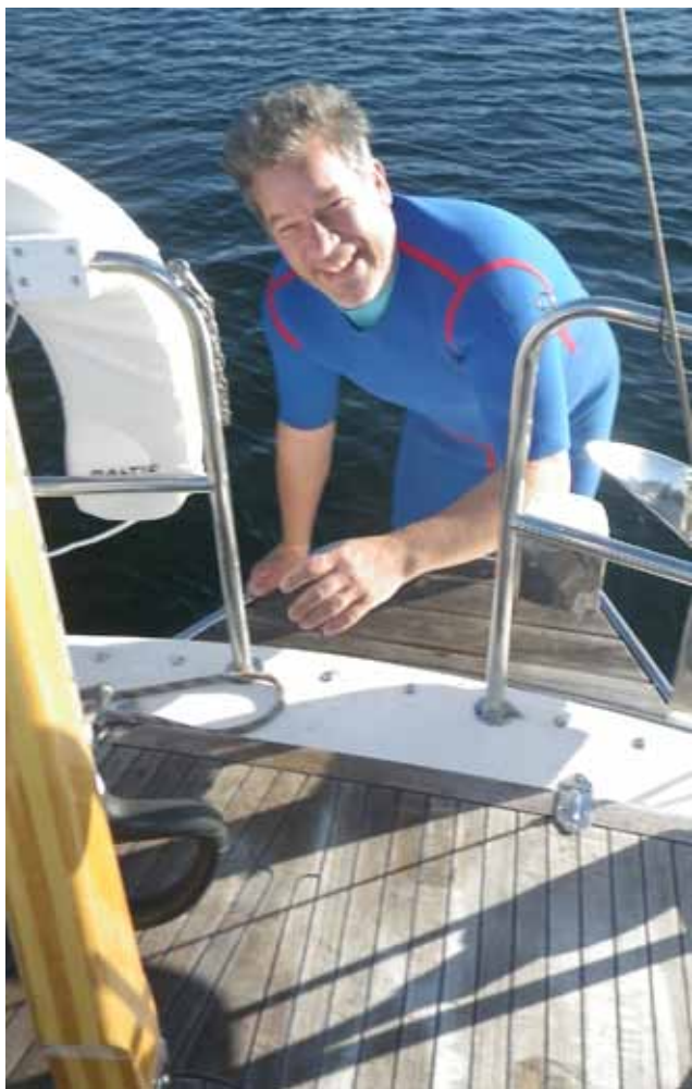
Per klar att dyka

reda ut allt utan större skador när det blev ljus så skulle vi i alla fall försöka ta oss till Mariehamn på fredagen för att vara med på returracet på lördagen.