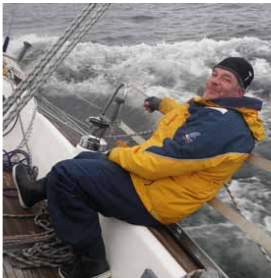
Per vid retrarracet

Nu är vi alltså i ett läge där vi kört över gennakern, tappats storen och har grynnor i lä. Vad göra? Jo, jag försöker starta motorn och drar omedelbart in baborskotet till gennakern (som lagt sig som ett hopprep under båten) i propellern! Läget blir ännu mer kritiskt men vi får i alla fall upp storseglet och försöker segla oss fria. Vi försöker även rulla ut focken men där visar det sig att tamparna till strumpan snott in sig i förstaget så focken går inte att rulla ut! Näväl, vi har ju ändå ett rätt stort försegel så det borde ju gå att kryssa sig loss från grynnorna ändå. Men vi har ju