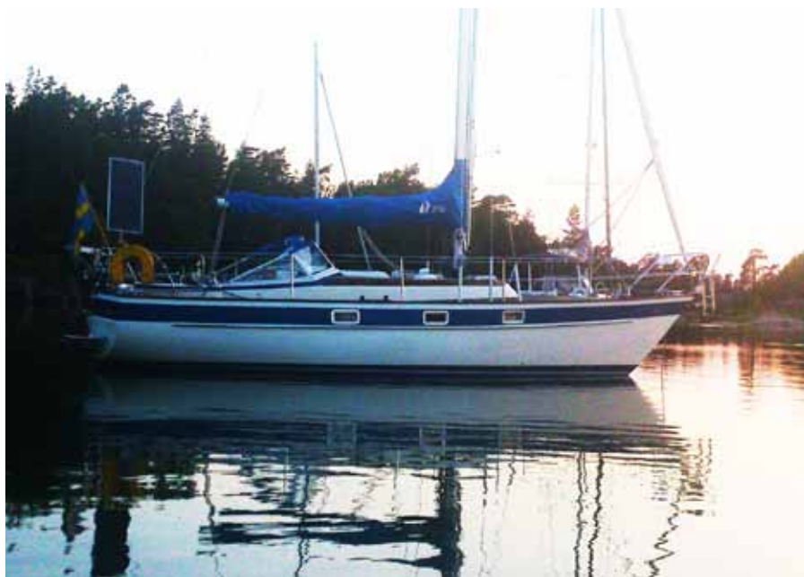
Fragancia på svaj

lyfte ner vårt vackra blanka rostfria 10-kilosankare från ankarhållaren på akterpulpiten och gick fram på fördäck för att lägga i det. Då hörde jag: Oj det lossnade! Tittade ut och såg honom stå där hållande i enbart ankartampen. Vårt vackra ankare hade gett sig i väg utan linan!!! Där stod han och tittade på en lina med