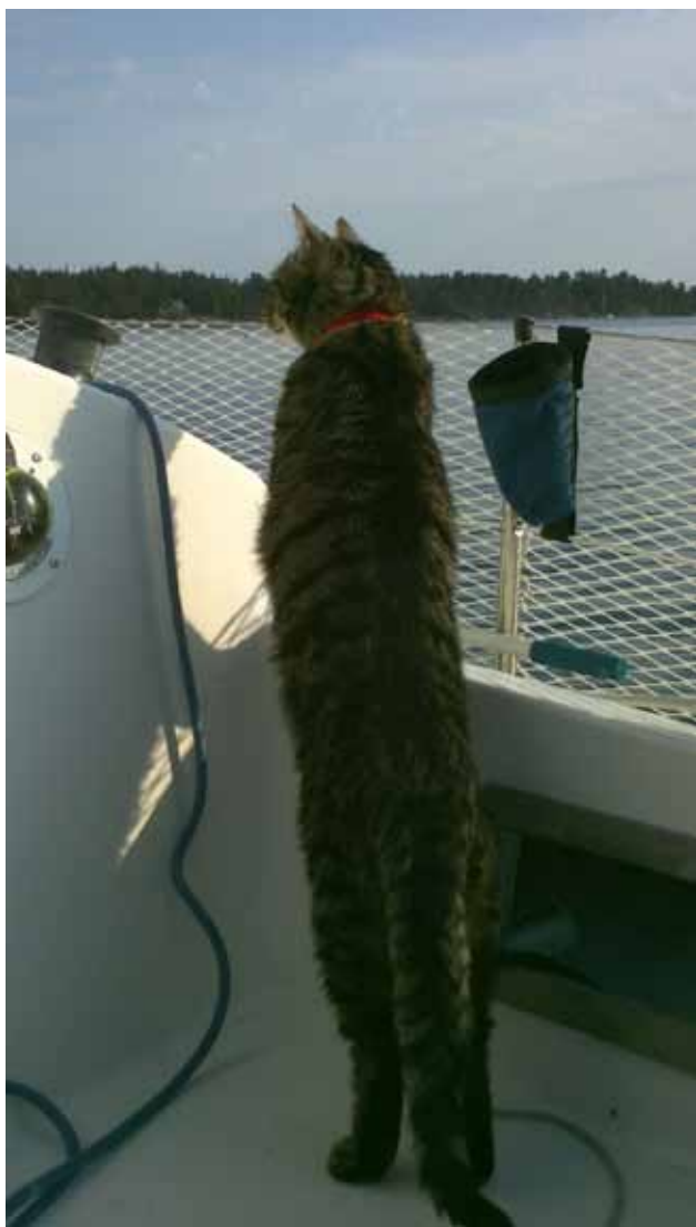
Tiger håller utkik.

aldrig skulle göra, då han trodde att det var vårt parkettgolv hemma. Det visade sig att hela viken blivit knökfull med algblooming och det påminde verkligen om vårt golv. Snabbt som tusan fick jag släppa på akterlinan och dra in mig till land varefter jag tog med mig en 10-litersdunk med färskvatten och hällde den över Tiger så att han blev av med