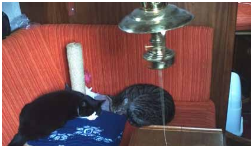
Kattoaletten syns delvis framför skottet.

För att det ska fungera bra så extrautrustar vi båten med kattoalett, klosspelare och diverse enkla kattleksaker. Klosspelaren är ett måste som sparar mycket inredning.